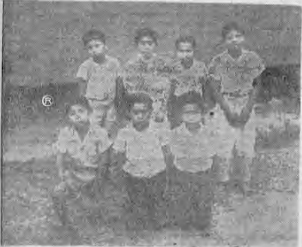
Grupo de niños indígenas que estudian su primera enseñanza en la escuela Doris Stone.