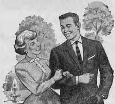
Tres conceptos de Victor Hugo.

Los gestos son una forma de confesar lo que se siente: miedo, impaciencia, odio, in- seguridad, y cuando se ma- nifiestan en forma constante, la persona debe someterse a un buen tratamiento médico, o sencillamente practicar la relajación de todos los múscu- los, respirando con profundi- dad hasta conseguir un alivio de la tensión que es la causa de esos gestos.