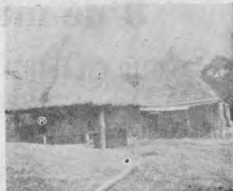
Los palanques indígenas