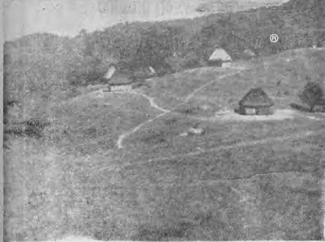
Viendo desde Salitre. Nótese lo disperso que quedan unos palanques de otros. El caserío está unido por simples trillos.